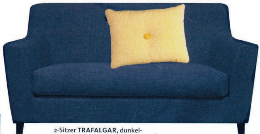
2-Sitzer TRAFALGAR , dunkelblauer Bezug aus Leinen-Baumwoll-Mix, 140 cm breit, ca. 530 Euro. Über www.fashionforhome.de