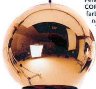
Pendelleuchte COPPER , aus kupferfarbenem Polycarbonat, ø 45 cm, von Tom Dixon, ca. 490 Euro. Über www.connox.de

Natürlich sind die Bücher hier die Deko-Helden (siehe Tipp). Aber Konkurrenz belebt das Geschäft: Deshalb macht sich das kleine Höckerchen im selben Farbspektrum wichtig. Und das Klavier rechts schindet auch Eindruck. Bleiben noch die Wand-Werke: ein schicker Mix aus Fotos, Lithografien und Frederikkens eigenen Arbeiten.