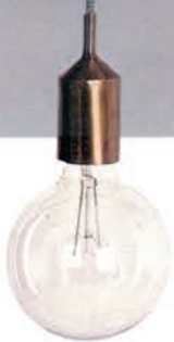
Lampenaufsatz KANT , kupferfarben, Nr: Ndo401, Ø 4,5 cm, 11 cm hoch, ohne Kabel und Glühbirne, von House Doctor, ca. 15 Euro.

Tipp Hängeschränke, die an der Wand angebracht werden, stehen nicht im Weg, wirken optisch schön leicht und bieten eine tolle Bühne für kleine Tischleuchten oder Vasen.