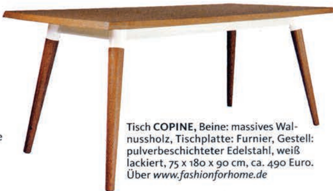
Tisch COPINE , Beine: massives Walnussholz, Tischplatte: Furnier, Gestell: pulverbeschichteter Edelstahl, weiß lackiert, 75 x 180 x 90 cm, ca. 490 Euro. Über www.fashionforhome.de

Handgearbeitete QUASTE , mit Schlaufe, 27 cm, in vielen Farben, von Quastenshop, ca. 25 Euro. Über www.dawanda.com